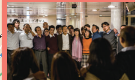
船上での同窓会シーンを撮影。