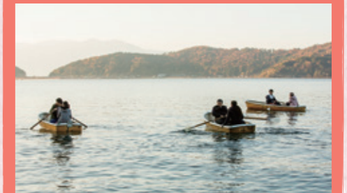
「明月館」の外観のシーン撮影は琵琶湖湖畔のこのあたり。