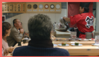
観光の合間の食事シーンは 大起水産でマグロを!

E 大起水産 道頓堀店 大阪府大阪市中央区道頓堀1-7-24 四海樓道頓堀ビル1F