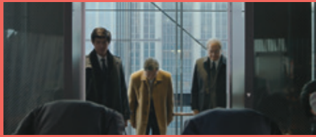
ジャッキーの得意先ビルの撮影場所。 ガラス張りのエレベーターが印象的。