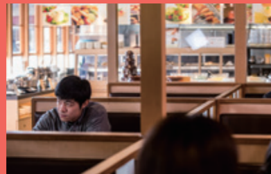
ジャッキー、大阪のソウルフード 「串カツ」を食べる。