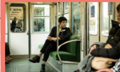
ジャッキーが車窓を見つめるシーンは 京阪電車石山坂本線で撮影した。