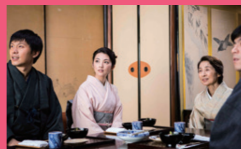
3人が日本旅館のおもてなしを学ぶ場面。