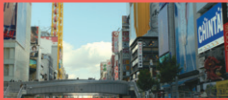
大阪観光といえばここ。劇中でも水上バスによって道頓堀を楽しむシーンが。