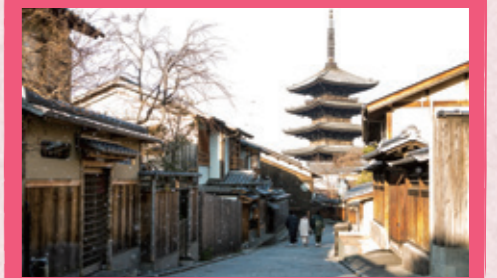
日本旅館から帰る坂道。京都らしい塔と降る雪が印象的。