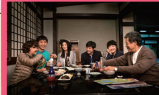
メインとなる老舗旅館「明月館」内部はここで撮影。